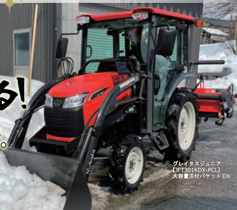
グレイタスジュニア 【JFT301KDX-PCL】 大容量爪付バケット DX