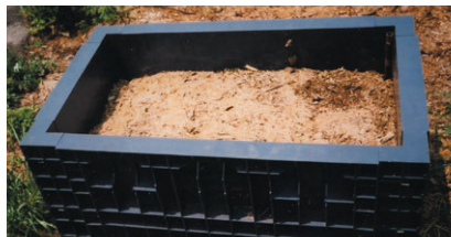
▲角形堆肥造り枠によるチップスの堆肥化

これまで焼却されてきた樹木もチップ処理することで、さまざまな目的に再利用が可能。