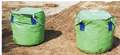
▲バッグ利用によるチップスの堆肥化

これまで焼却されてきた樹木もチップ処理することで、さまざまな目的に再利用が可能。