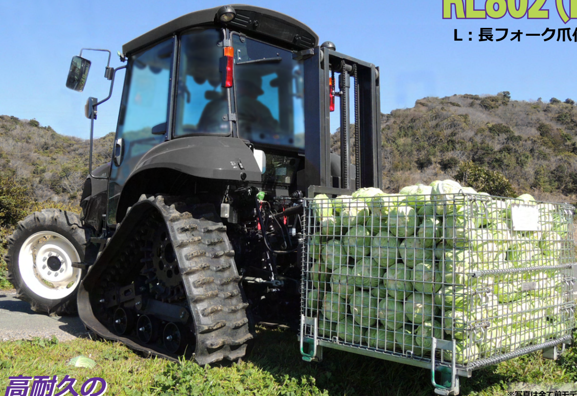
※写真は全て前モデルのRL801